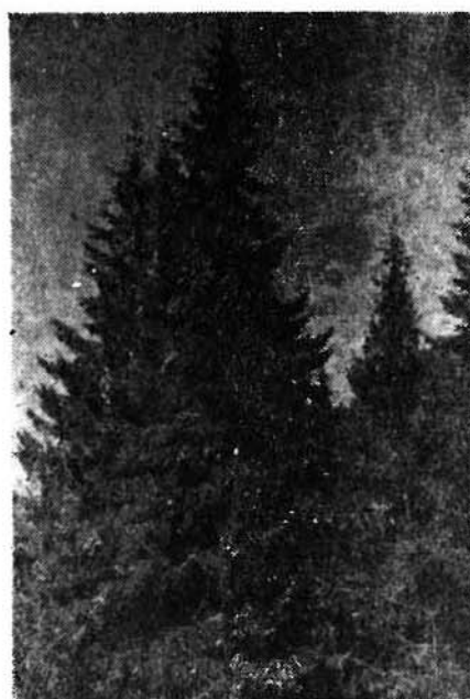
Fig. 1. Molizi cu fructificații (Valea Putnei). (Original) Fig. 1. Epicéas avec des fructifications (Valea Putnei). (Original)