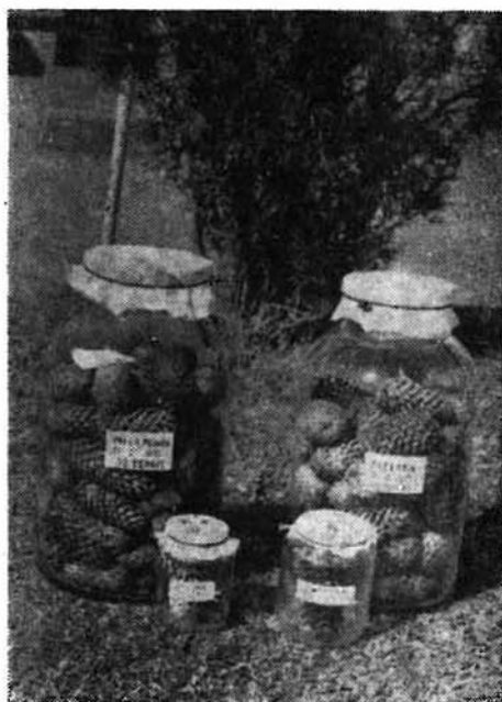
Fig. 2. Borcane conținând conuri de molid infestate de dăunători. (Original) Fig. 2. Pots contenant des cônes d'épicéa infestés par des nuisibles. (Original)