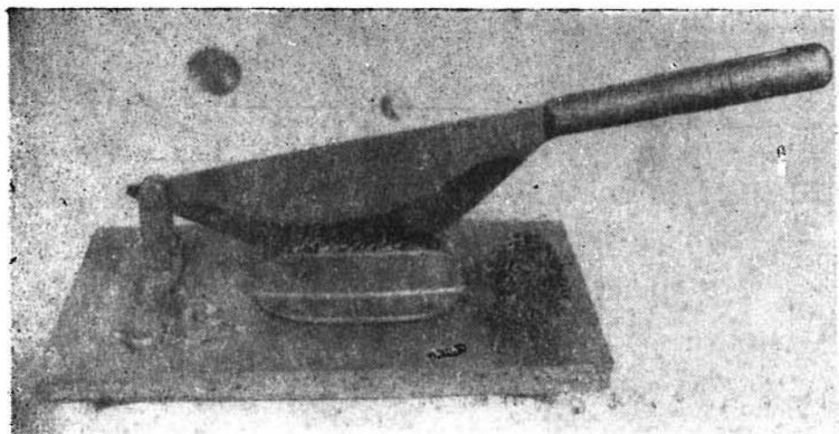
Fig. 3. Dispozitiv pentru secționarea conurilor. (Original) Fig. 3. Dispositif pour le sectionnement des cônes. (Original)