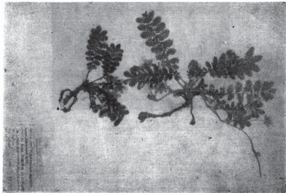
Fig. 2. Potentilla anserina L. var. tuberosa Wolf.