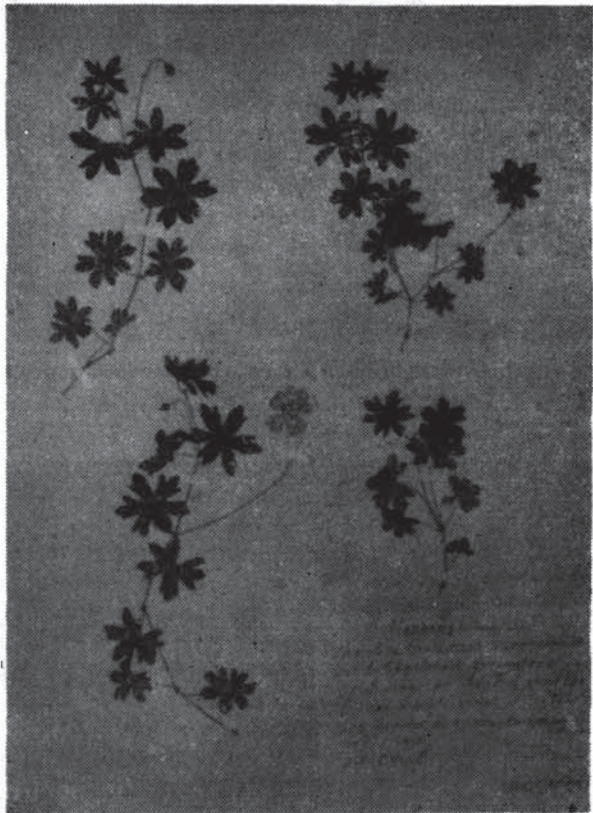
Fig. 3. Geranium sanguineum L. var. latipartitum Petunnikov.